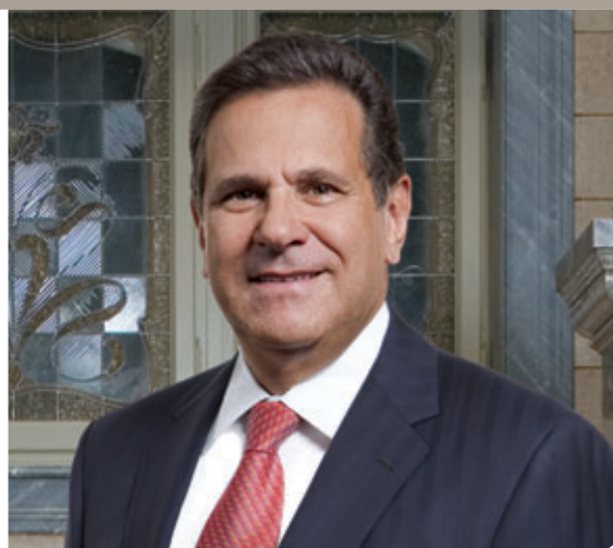
James J. Schiro Chief Executive Officer

Le Zurich Way a dépassé son objectif de 800 millions d'USD de bénéfices prévus pour 2008, jetant les bases d'une augmentation et d'une expansion des objectifs pour les trois prochaines années. Par ailleurs, la cohérence des plateformes opérationnelles du Zurich Way crée une valeur importante dans nos efforts d'intégration consécutifs aux acquisitions, les 15 transactions annoncées au cours des deux dernières années bénéficiant de nos approches des meilleures pratiques et servant de sources de nouvelles connaissances pour le groupe élargi.