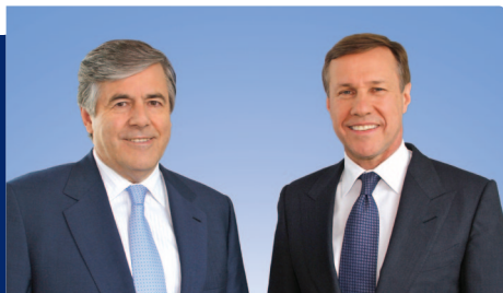
Dr. Josef Ackermann