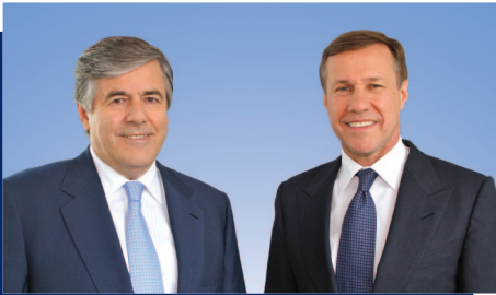
Dr. Josef Ackermann