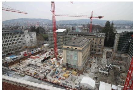
Die Bodenplatten der Neubauten entlang der Breitingers- und Alfred-Escherstrasse sind bereits gut erkennbar.